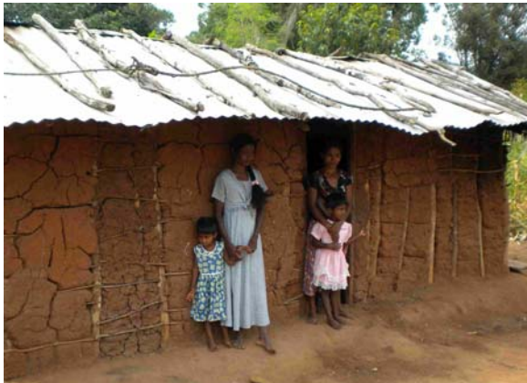
Zulke behuizing is er veel in de buitengebieden; ook hier zou hulp geboden moeten kunnen worden

We krijgen een goede indruk van het management en spreken af in eerste instantie één van de zes punten uit de lijst met aanvragen te helpen realiseren. Dat is de (af)bouw van een hal met boven een slaapzaal. Betonnen stenen hiervoor worden door de jongens zelf gemaakt.